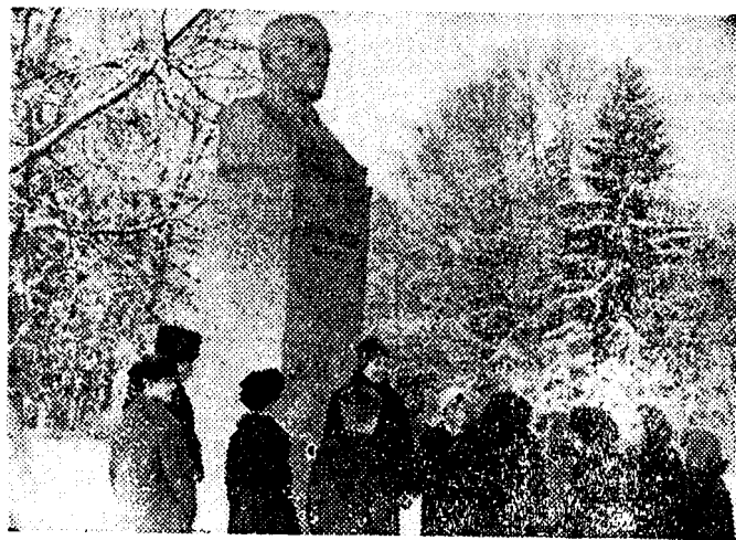
Pildil: 5 aastat tagasi Muuga 8-kl. Kooli juurde püstitatud Ed. Vilde mälestussammas.

Vanad pärnad ja vahtrad pargis on Vilde-päevist saadik kõrgemaks-jämedamaks kas-