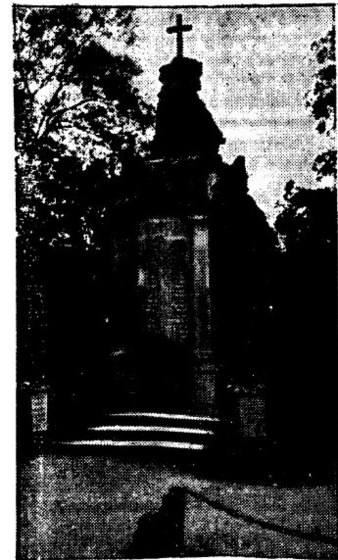
Kadrina mälestussammas oma täies uhkuses enne bolševistlikku hävitustööd.

Tulles tagasi mälestussammaste lõhkumise juurde, peatume lähemalt teistes Virumaa suuremates keskustes asetsevate mälestussammaste lõhkumise juures, mis aset leidsid ühel ajal Rakvere mälestussamba hävitamisega.