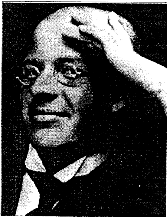
Eduard Wiiralt 1925. a. Tartus.