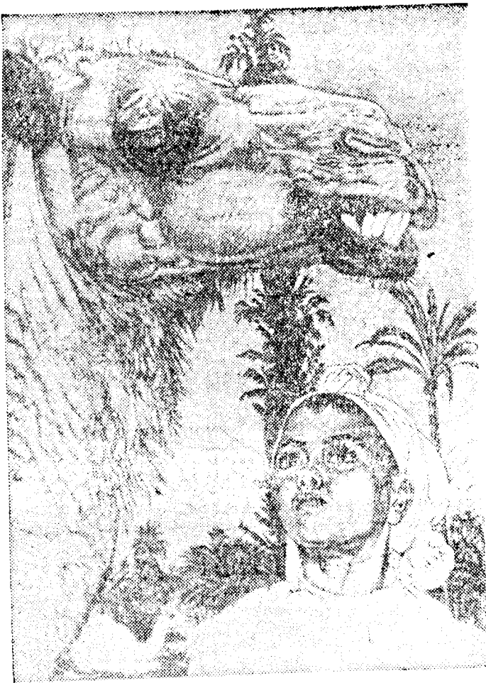
Berberi tüdruk kaameliga. Vernis mou. 1940.

damatu hulk lühiülevaateid nii eesti kui teistes keeltes. 1959. aastal ilmusid Tallinnas massilistes tiraažides Viiralti album (20000) ja «20 reproduktsiooni» (12000). 1965. aastal avati Varangu kodumaja seinal kunstnikule tagasihoidlik mälestustahvel.