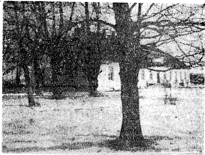
Endise Pähdivere mõisa häärberihoone.