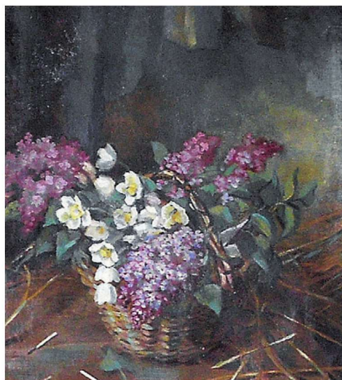
Anemoonid ja sirelid korvis on maalitud lõuen-dile tõenäoliselt kohe peale sõda.