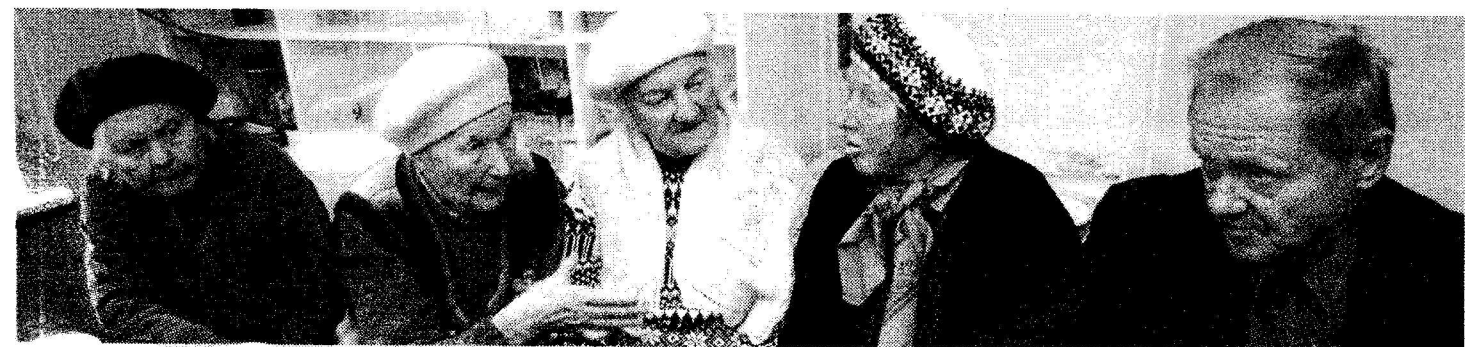
Eakate klubi liikmed meenutasid koosviibimisel lugusid, mis Moe kandiga meenusid, tähtsal kohal oli piiritusetehas, mis pea iga jutuga haakus.