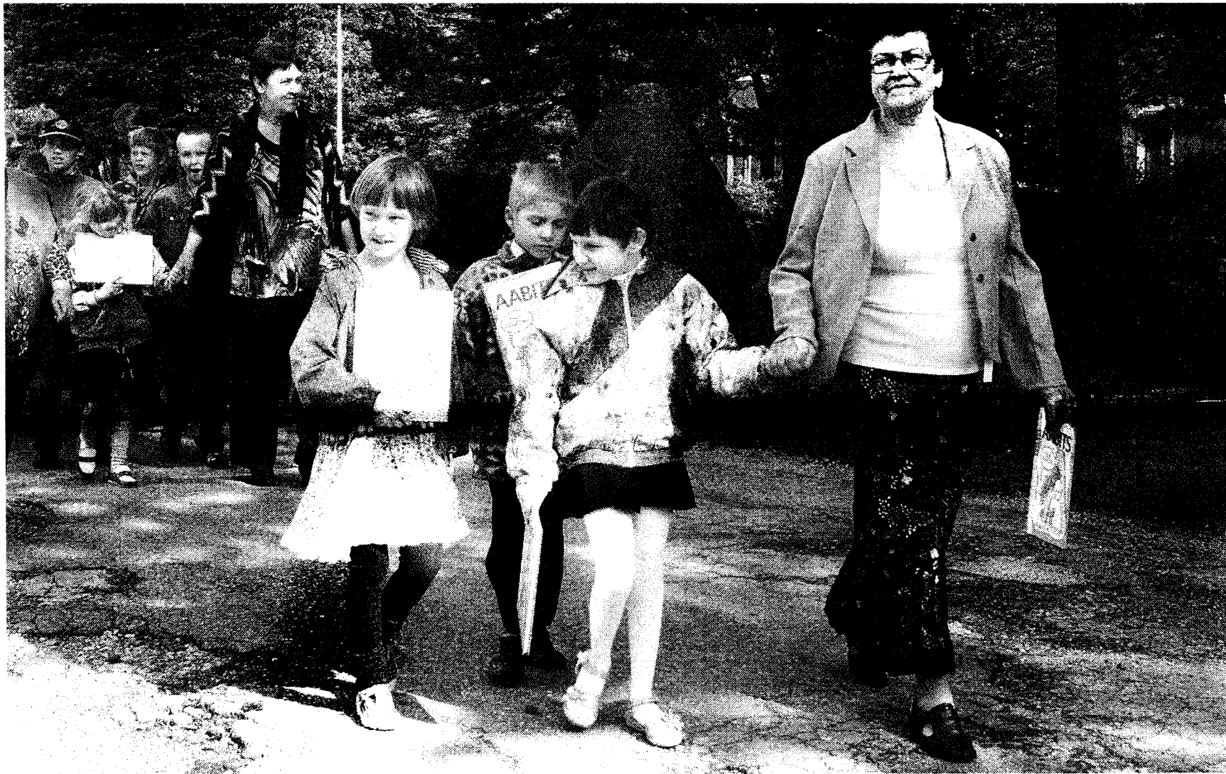
Porkuni kooli pere lahkub rongkäigus ajaloolises mõisa-hoones asunud koolist, et suunduda uude ja avarasse majja.

Asja valminud, terviklikus koolikompleksis on kaks õpilaskodu, kaks õppehoonet, hooldusklassid, lasteaed, spordi- ja rehabilitatsioonikeskus võim-