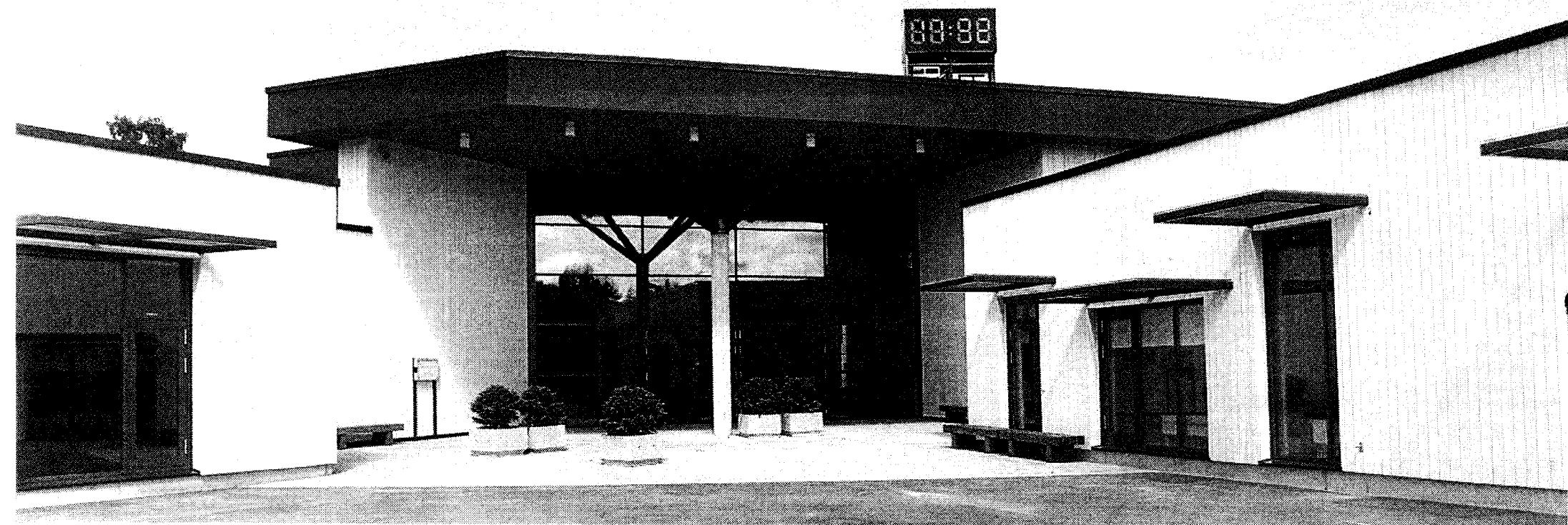
Vanast koolimajast kiviviske kaugusel asuv ühekorruseline kompleks valmis vastavalt Porkuni koolipere soovidele, näpunäidetele ja vajadustele.