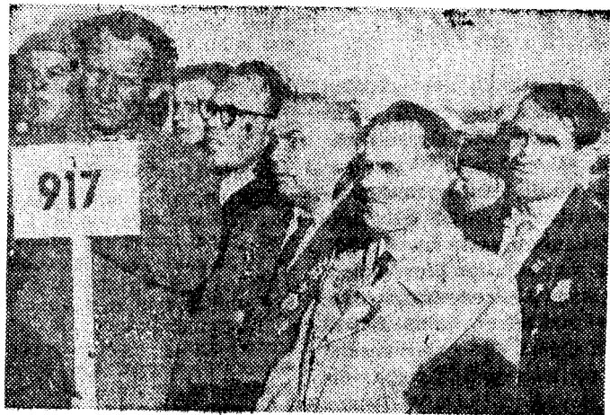
«Kas mäletad?» Niiviisi võis kuulda sõjaveterane alustamas meenutusi Porkuni lahingust. Nüüd tuletab mälestuskivi aga kõigile meelde, et siin leidis aset viimane tõsisem vabastuslahing Eesti mandril. Pildil grupp veterane mälestuskivi avamisel.