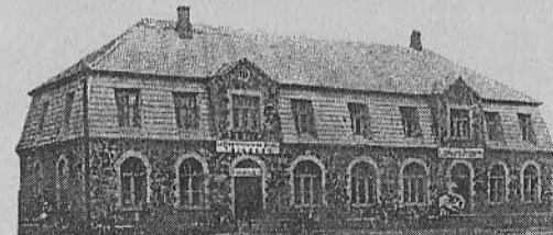
LÆKVERE TARBIJATE ÜHISTU