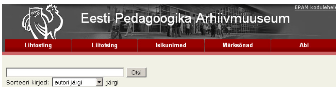
Joonis 13. E-andmebaasi avaleht.

E-andmebaas asub aadressil http://epam.tlu.ee/ . Muuseumi e-andmebaasi veebileht on jagatud viide osasse. Neist neli esimest on mõeldud otsingute tegemiseks ja viies on abimaterjal otsingute teostamiseks (vt Joonis 13). Abimaterjalis on kirjas väga üldine info, järgnevalt tutvustatud probleeme ei ole seal kirjeldatud.