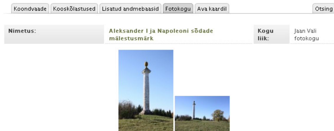
Joonis 31. Monumendi juures on viide ainult Jaan Vali fotokogule

Näiteks on fotokogus nii Jaan Vali kui ka Veljo Ranniku fotod Lääne-Virumaal, Mõdrikul asuvast monumendist. Kultuurimälestiste registrit vaadates võib aru saada, et fotokogus on ainult Jaan Vali fotod, sest teise fotograafi fotodele siin viide puudub (vt Joonis 31).