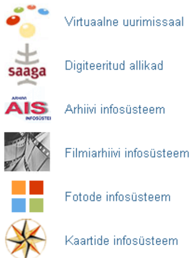
Joonis 2. Rahvusarhiivi e-andmebaasid

Algselt oli eesmärk tutvustada magistritöös ka teisi e-andmebaase (näiteks Eesti Kirjandusmuuseumi või Rahvusarhiivi e-andmebaase, vt Joonis 2), aga nende tutvustusi kaasates oleks uurimistöös mitmes osas liiga üldiseks jäänud. Metaandmete probleemid ilmnevad paremini, kui minna e-andmebaasiga tutvumisel süvitsi.